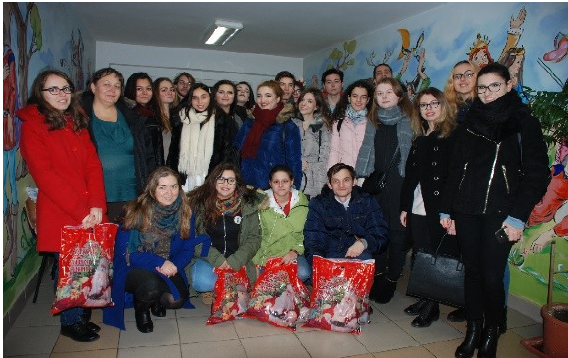
❖ DECEMBRIE 2017 - "SĂRBĂTORILE DE IARNĂ, CULORI ALE BUCURIEI NOASTRE", EDIȚIA A II-A