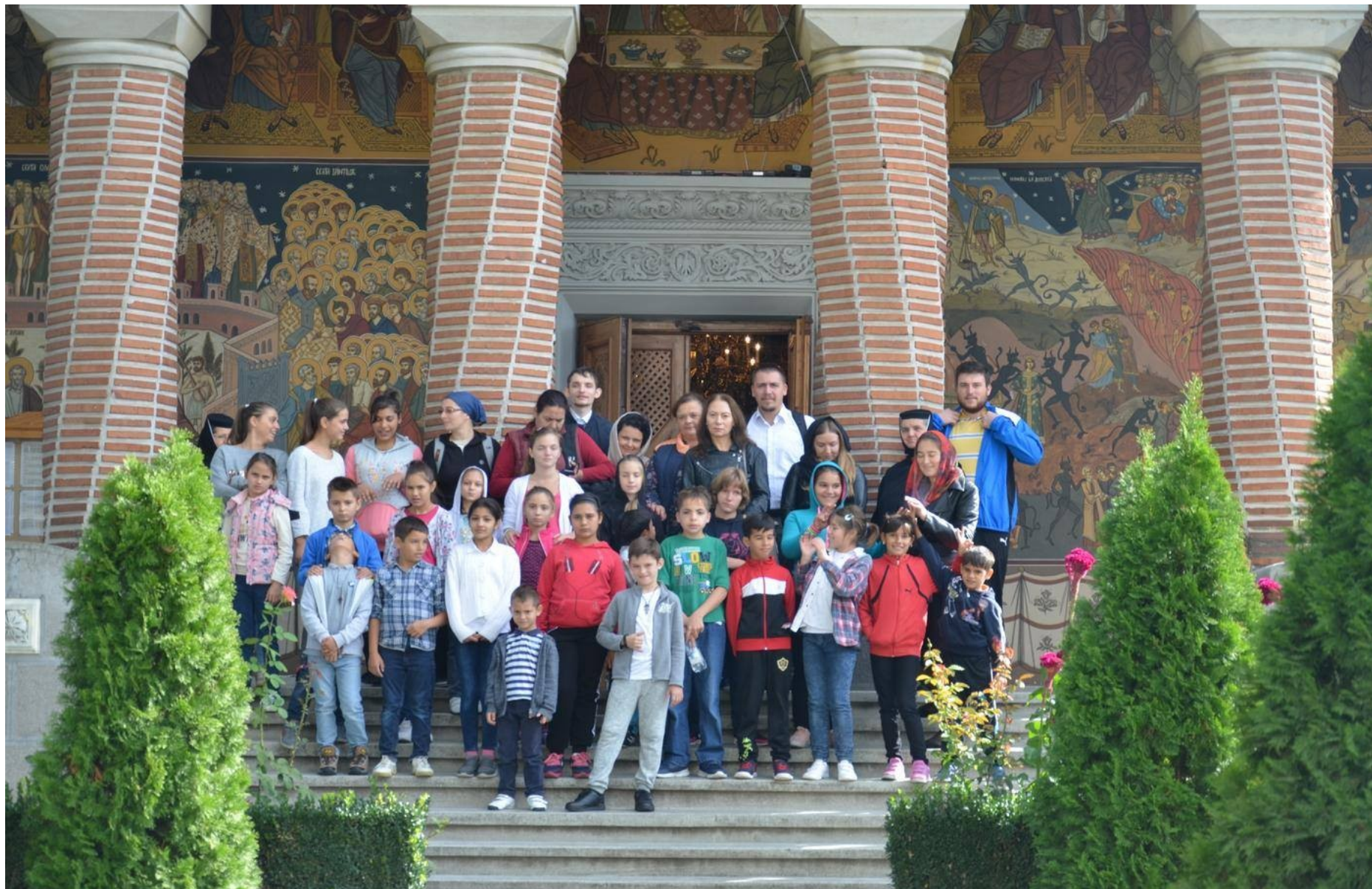
❖ SEPTEMBRIE 2017 – PELERINAJUL "CĂLĂTORIE SPRE CER" LA MĂNĂSTIREA "BUNA VESTIRE" – MALUL SPART.