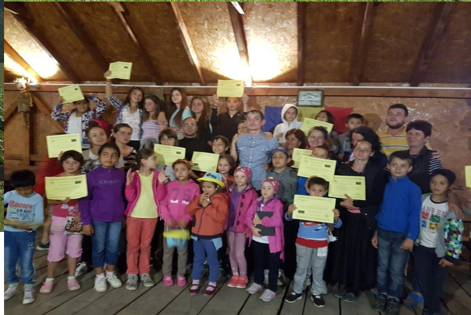
❖ IULIE 2017 – TABĂRA DE VARĂ ”BUCURIE PENTRU TOȚI – I”.